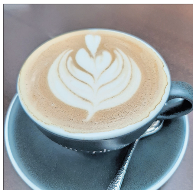
Nach dem Rundgang durch die Produktionsstätten der Firma Thermoplan wurde allen Teilnehmenden ein feiner Kaffee ihrer Wahl serviert.