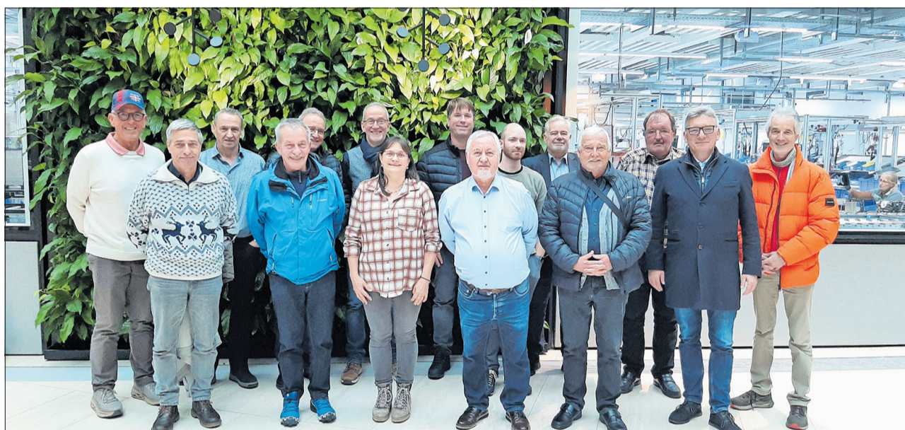
Gruppenbild im hauseigenen Café der Firma Thermoplan mit Blick in die Produktionsstätte im Hintergrund.

Nach einem kurzen «Ausflug» in die aussergewöhnliche Stellung von Weggis im Mittelalter – Weggis wurde als einer der ersten Orte bereits im Jahr 1332 von Habsburg unabhängig – erläuterte der Zentralpräsident Markus Meyer, dass die diesjährige Klausurtagung unter dem Motto «Reflexion und Weichenstellung» zusammengefasst werden kann. Er wünschte allen Teilnehmenden, ganz im Sinne des einstigen Knotenpunkts Weggis für Austausch und Begegnung, «einen erfolgreichen und inspirierenden Austausch».