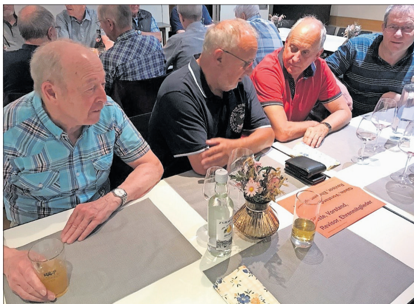
Archivbild: Teilnehmer an der Generalversammlung 2025 im Restaurant Brückli in Schattdorf.