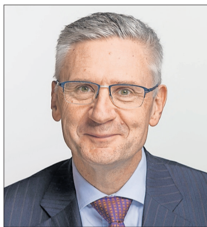
Nationalrat Andreas Glarner will keine berufliche Vorsorge schwächen.

Der Vorschlag, freiwillige Zusatzbeiträge zu verhindern, ist unsinnig. Er leugnet das von allen beneidete Drei-Säulen-System und schränkt die Eigenverantwortung ein. Erstaunlich für einen Parlamentarier seiner politischen Richtung. ■