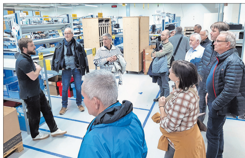
Spettatori attenti durante la visita alla Thermoplan di Weggis.