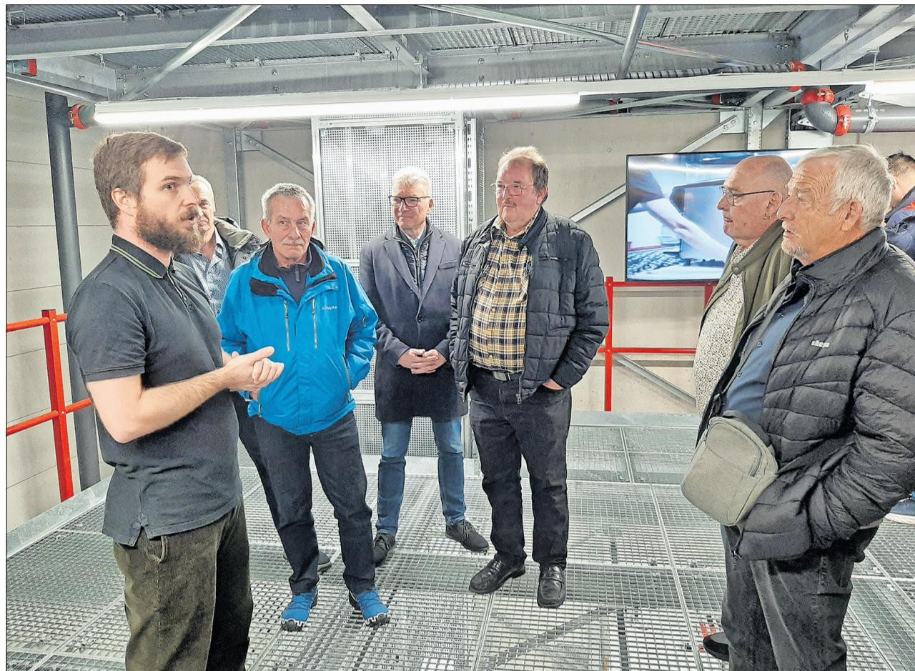
Auditeurs attentifs lors de la visite guidée de l'entreprise Thermoplan à Weggis.

Beat Wenzinger Rédacteur swissPersona Traduction Jean Pythoud