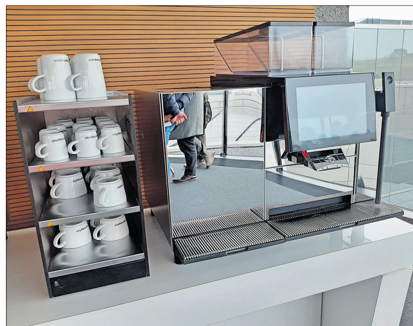
Une machine à café dans l'entreprise Thermoplan.