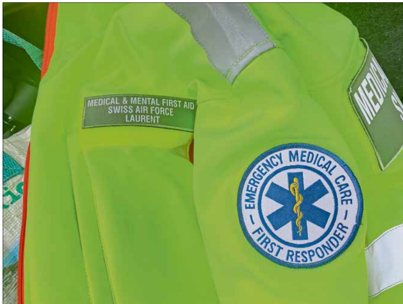
Le dispositif des secouristes en santé mentale peut être mis en place rapidement. En 2025 il a rendu service à 25 collaborateurs sur Payerne.