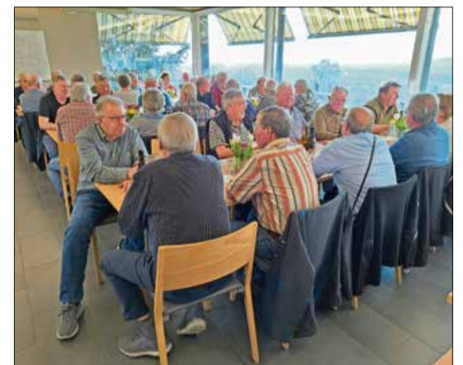
Die Teilnehmenden an der Jahresversammlung 2026.