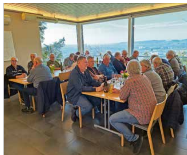
Blick in die Versammlungsrunde mit Ausblick.