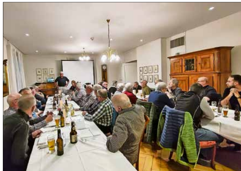
Ein Blick in die Versammlungsrunde.