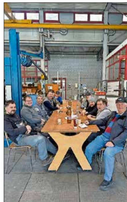
Mitglieder der Sektion Ostschweiz.