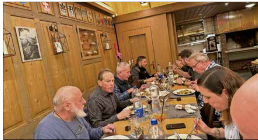
Im Anschluss durfte das feine Nachtessen nicht fehlen.