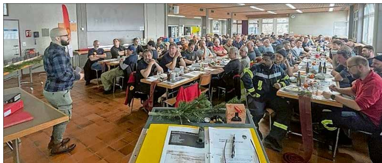
Werbeanlass am Schlussrapport der Betriebsfeuerwehr in Hinwil.